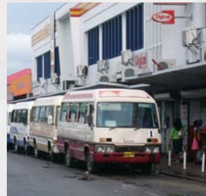
Bussen van lijn 1