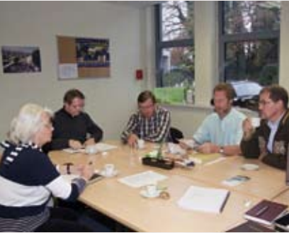
Leden van de werkgroep