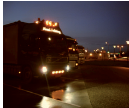
Een parkeerplaats voor trucks

Maar toch zijn er ook goede gesprekken. Over hun leven en hun ideeën over God. Vooral die ideeën en kritische vragen over Gods bemoeienis met het leven zijn niet altijd gemakkelijk. Toch probeer ik hen te vertellen over de Here Jezus en hoe een vertrouwen op Hem het waard is om mee te leven. Ik mocht bij een chauffeur in de cabine met hem bidden. Ze krijgen de CD "Ongelooflijk" mee en samen met de chauffeurs van het "Chauffeurs Evangelisatie Team Holland" ( www.truckplus.org ) maakt GRN misschien nog wel eens een echte "Chauffeurs CD".