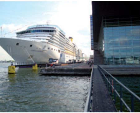
Cruiseschip aan de Amsterdamse kade