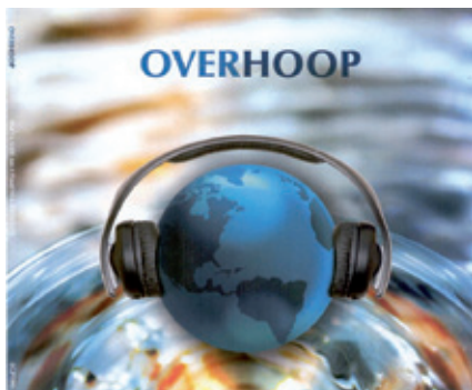
De nieuwe Vlaamse CD 'Overhoop'

Het mooiste is om, zoals in diverse havens in Alaska, en hopelijk binnenkort ook in het Noorse Bergen, een gebouwtje te hebben, een christelijk zeemanshuis, waar je zeelieden kunt uitnodigen en veel meer mogelijkheden hebt om hen te bemoedigen en het evangelie uit te dragen. Wilt u zomers in Amsterdam meehelpen? Laat het ons weten.