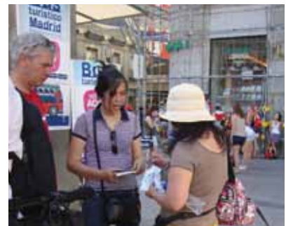
CD's worden uitgedeeld in Madrid