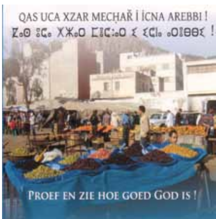
DVD voor Marokkanen