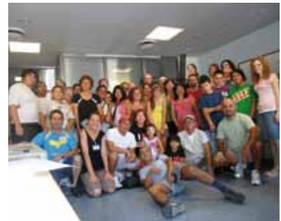
Het complete team dat hielp in Madrid

Vanaf het begin werden onze verwachtingen overtroffen. Gelukkig maakte onze CD-leverancier per ongeluk 5000 teveel Spaanse CD's getiteld "Verlangen naar God". Hierdoor hadden we extra materiaal om uit te delen. Na de eerste dag waren bijna alle Engelse CD's op! We moesten de multicopier uit Ciudad Real naar Madrid laten brengen om meer CD's te kunnen maken. De laatste drie dagen en nachten van de campagne hebben mensen elkaar afgelost om 5.600 extra CD's te maken. De meest gevraagde talen waren behalve Spaans ook Engels, Italiaans, Portugees, Duits en Frans. Bidt u mee voor hen die CD's ontvangen hebben en voor hen met wie we fijne diepgaande gesprekken hebben gehad?