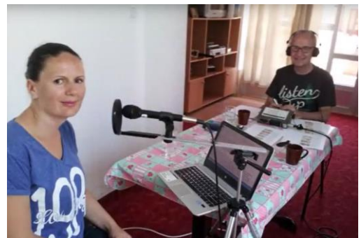
Opnames in Kosovo