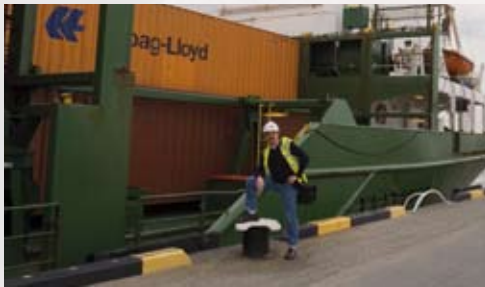
In de haven van Rotterdam

dus blij met enige persoonlijke aandacht en vinden het geweldig om iets te kunnen horen in hun eigen taal. Naast audio-opnamen staat er ook christelijke muziek op de CD's waar men naar kan luisteren. We zijn blij dat de CD's naast andere materialen, zoals boeken, video's, bijbels of bijbelstudies in een behoefte voorzien. Ook konden we die dag foto's maken voor ons archief. Er is nl. een grote behoefte aan Europees fotomateriaal om het werk meer bekendheid te geven.