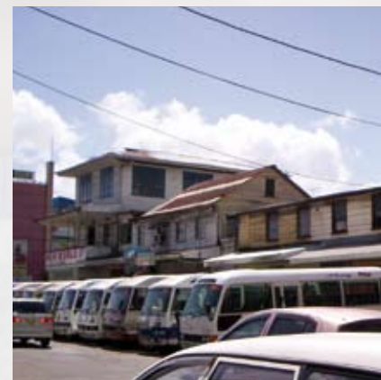
Het busstation aan de Heiligenweg in Paramaribo.