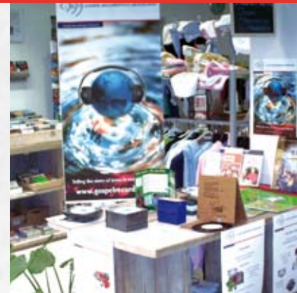
Projecttafel in 'De Fontein', te Hattem.