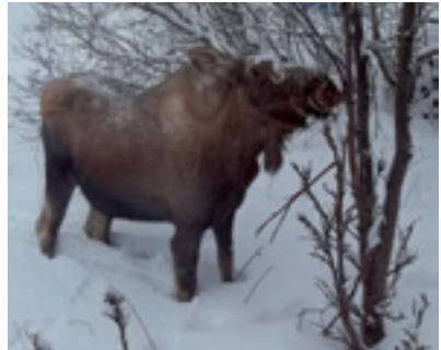
Winter! Zelfs de elanden hadden het zwaar.

'Gods wegen zijn hoger dan de onze...', zegt Jesaja.