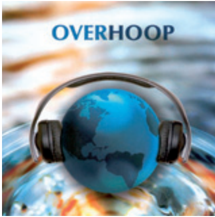
De Vlaamse CD 'OverHoop'

Recentelijk announceerde het 'Reformatorisch Dagblad' dat in België de Pinksterkerken hard groeien en met name gaat het dan om de immigrantenkerken. Mooi om over geestelijke groei in dit land te horen.