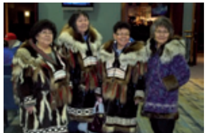
Eskimo's, waarvan rechts de vertaalster.