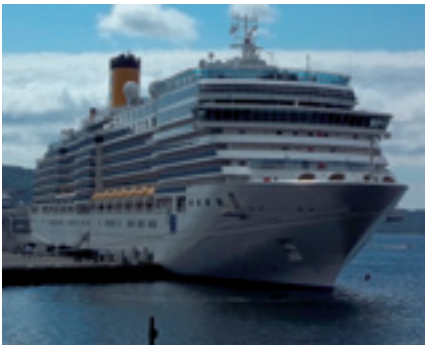
Nieuw seizoen cruiseschepen

Ik vind het daarom een eer om ambassadrice te mogen zijn van GRN en zo mensen bekend te mogen maken met het werk dat GRN doet; het evangelie vertalen in alle talen die deze wereld kent, zodat alle mensen mogen horen wie Jezus Christus is! Helpt u mee?!